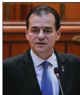
Prim-ministru - Ludovic Orban