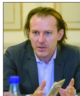
Ministrul Finanțelor Publice - Vasile Florin Cițu