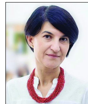
Ministrul Muncii și Protecției Sociale - Victoria Violeta Alexandru

Executivul Orban a fost investit, luni în plenul reunit al Parlamentului, cu 240 de voturi „pentru”, din cele 233 de voturi necesare investiturii. Deputații și senatorii au votat pentru validarea listei celor 16 miniștri, precum și programul de guvernare al PNL. După anunțarea rezultatului (în jurul orelor 16.30), Ludovic Orban a luat cuvântul de la tribuna plenului reunit și a spus scurt: „Vă mulțumesc și aveți încredere în noi”.