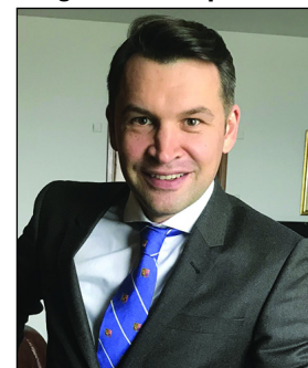
Ministrul Tineretului și Sportului - Marian Ionuț Stroe