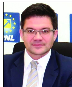
Ministrul Mediului, Apelor și Pădurilor - Costel Alexe