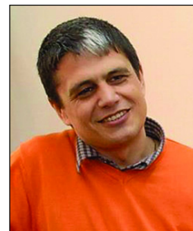
Ministrul Fondurilor Europene - Ioan Marcel Boloș