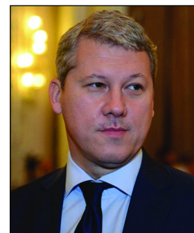
Ministrul Justiției - Marian Cătălin Predoiu