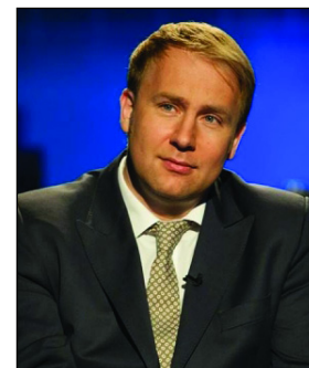
Ministrul Sănătății - Victor Sebastian Costache