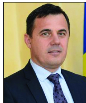
Ministrul Lucrărilor Publice, Dezvoltării și Administrației - Ion Ștefan