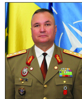
Ministrul Apărării Naționale - Ionel Nicolae Ciucă