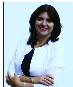
Ministrul Educației și Cercetării - Cristina Monica Anisie