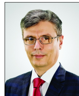
Ministrul Economiei, Energiei și Mediului de Afaceri - Virgil-Daniel Popescu