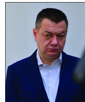
Ministrul Culturii - Bogdan Gheorghiu