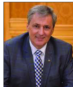
Ministrul Afacerilor Interne - Marcel Ion Vela