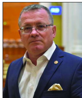
Ministrul Agriculturii și Dezvoltării Rurale - Nechita-Adrian Oros