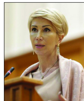
Viceprim-ministru - Raluca Turcan