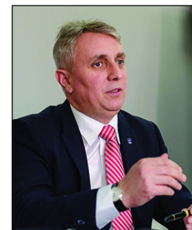
Ministrul Transporturilor, Infrastructurii și comunicațiilor - Lucian Nicolae Bode